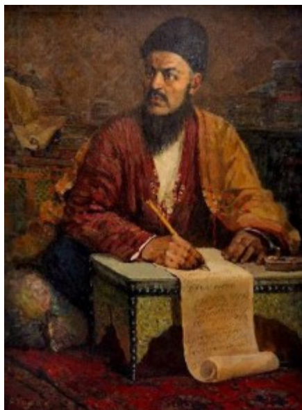
Рисунок 10. А. Хаджиев. Портрет Махтумкули. 1947 г.

Самый значимый канонический портрет в туркменской живописи был создан народным художником Туркменистана Айханом Хаджиевым ещё во время его студенчества, то есть в Москве и был посвящён Махтумкули Фраги (рис. 10).