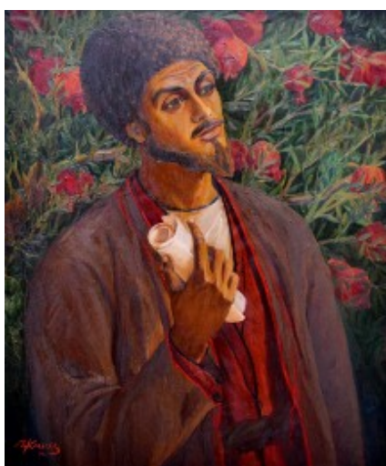
Рисунок 9. И. Клычев. Мятаджи. 1976 г.