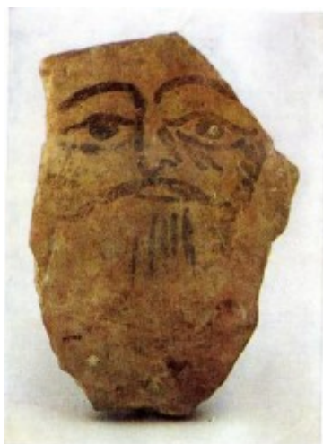
Рисунок 1. Лицо человека на черепке. Керамика с Мансурдепе. II-I тыс. до н.э.

Особенно живопись сохраняет живым и нетронутым чувства художника, донося всю трепетность отношения к изображаемому сюжету картины. Искусство – это особое средство в формировании человека. Ценно и то, что оно пробуждает философское отношение к жизни. Любое произведение искусства строится по определённым, логичным представлениям художника об окружающем мире, о смысловых связях, явлениях, предметах и об их назначениях. Так можно подойти к осознанию замысла художника, то есть о чём написана картина, к пониманию связи между содержанием и выразительными средствами творчества. В изобразительном искусстве заключено особое качество – чувственная достоверность. Это нечто другое, чем убедительность слова. Так как убедительность слова есть результат высоко развитой мысли, а убедительность изображения есть достоверность самого предмета, непосредственно открываемого зрению. «Живопись – дочь природы», - вот на чём особенно настаивал Леонардо [2, с. 54-55].