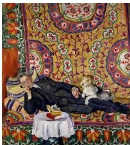
4. П. Кончаловский. Портрет В. Мейерхольда. 1938 г.

Художественный образ человека здесь подчиняется определённым канонам построения пространства и объёма. Здесь фон подчиняясь колориту открывает фигуру, лицо, руки и раскрывает характер портретируемого человека. Для этого используют оттенки так называемых холодных и тёплых красок. В портретах чаще всего используют нейтральный сдержанный фон, которым отчётливо выявляют особенности внешнего вида человека. «Канонический» портрет является признанным эталоном характерной внешности определённой исторической личности.