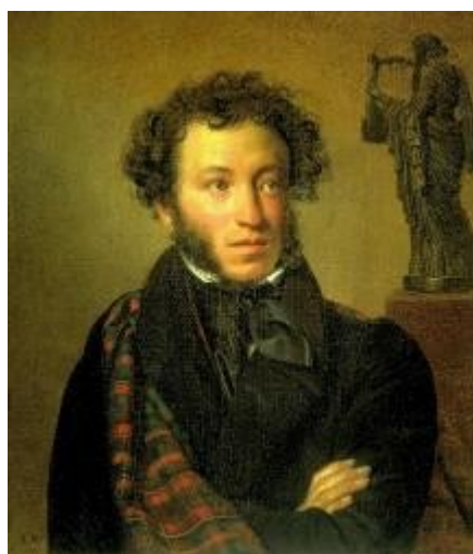
Рисунок 11. О. Кипренский. Портрет А. С. Пушкина. 1827 г.

Это произведение смело можем сравнить с портретом Александра Сергеевича Пушкина (1827 г.) (рис. 11) русского живописца Ореста Кипренского.