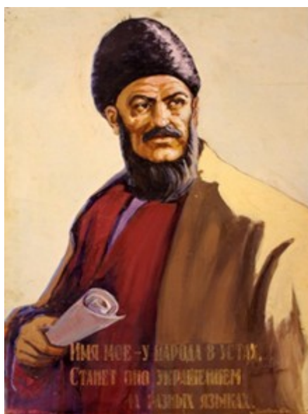
Рисунок 14. В. И. Овчинников. Махтумкули. 1970 г.

Художники Туркменистана, воодушевлённые стихами Махтумкули, многократно пытались представить и создать внешность поэта в скульптуре, живописи и графике (рис. 14).