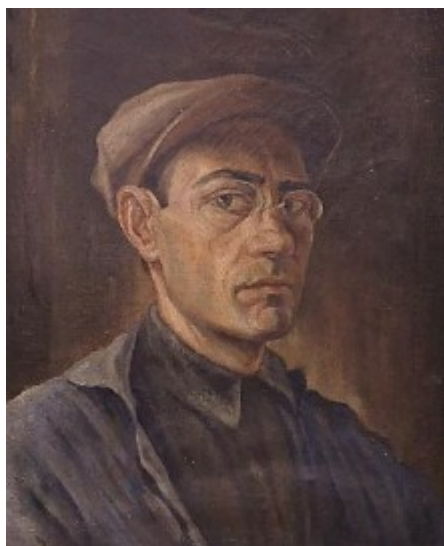
Рисунок 5. С. Бегляров. Автопортрет. 1932 г.

В развитии жанра портрет огромный вклад внесли художники европейской и русской школы живописи. Туркменская же школа изобразительного искусства взяла у них все самые лучшие качества и развила в методики работы с материалом, создавая свою современную национальную живопись. Это мы можем видеть на примере портретных работ С. Беглярова «Автопортрет» (1932 г.) (рис. 5) других художников.