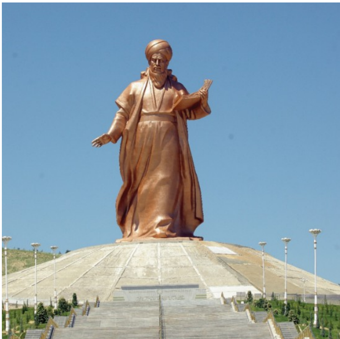
Рисунок 16. С. Бабаев. Махтумкули Фраги. 2022 г. Ашхабад

Современное видение художественного образа Махтумкули Фраги отражается в работах молодых художников и корифеев изобразительного искусства Туркменистана. Например, интересны тематические работы П. Гаррыева «Фраги» (2012 г.) и М. Кулиева «Махтумкули Фраги» (2017 г.) и «Махтумкули Фраги, воспевающий Отечество» (2019 г.).