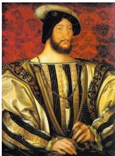
Рисунок 3. Жан Клуэ Младший. Портрет Франциска- I. Около 1525–1530 г.