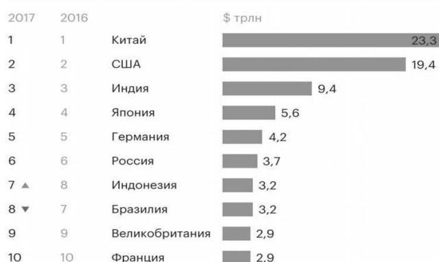
Рисунок 1 – Мировой рейтинг экономик по ВВП по паритету покупательской способности.

Как известно, в условиях нынешнего роста цен на энергоносители, перед потребителями электроэнергии стоит задача снижения энергоемкости выпускаемой продукции и услуг [2].