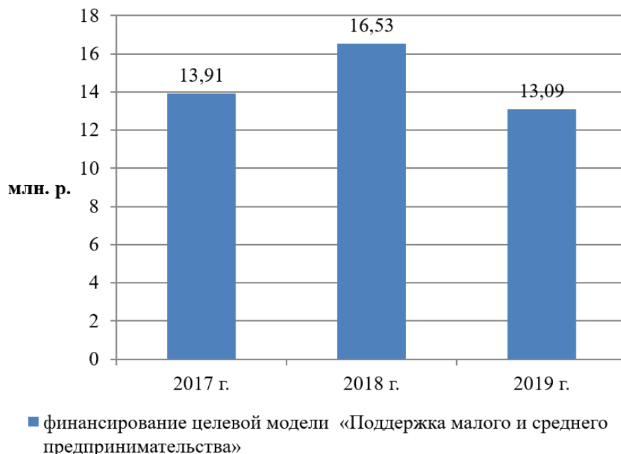
Рисунок 1 – Объем финансирования целевой модели «Поддержка малого и среднего предпринимательства» в г. Оренбурге за 2017-2019 гг.

предпринимательства», объем финансирования, которых представлен на рисунке 1.