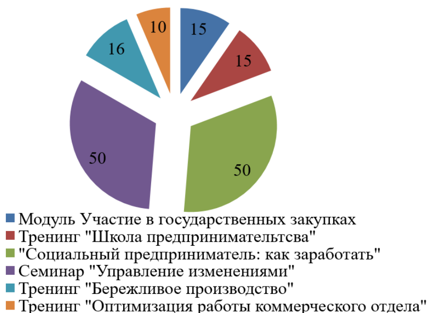
Рисунок 2 – Количество субъектов малого и среднего предпринимательства г. Оренбурга, воспользовавшихся услугами Центра поддержки предпринимательства при Гарантийном фонде Оренбургской области

В 2019 г. услугами Центра поддержки предпринимательства при Гарантийном фонде Оренбургской области пользовались также субъекты малого и среднего предпринимательства г. Оренбурга (рисунок 2).