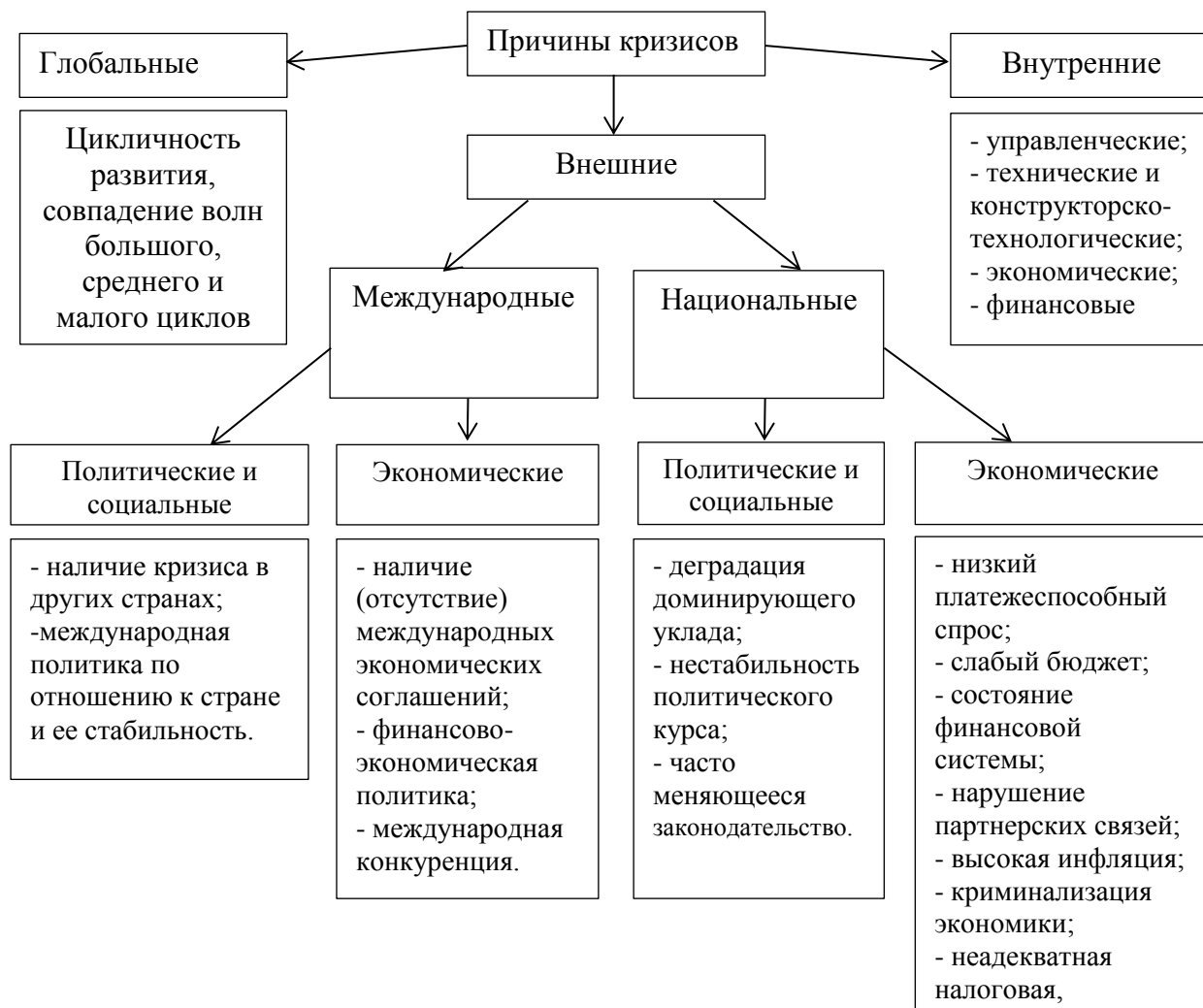
Рисунок 2. Основные причины кризисов на предприятии.

Внешние причины кризиса можно разделить на международные и национальные группы причин. В свою очередь в рамках международных и национальных причин можно выделить политические, социальные, а также экономические.