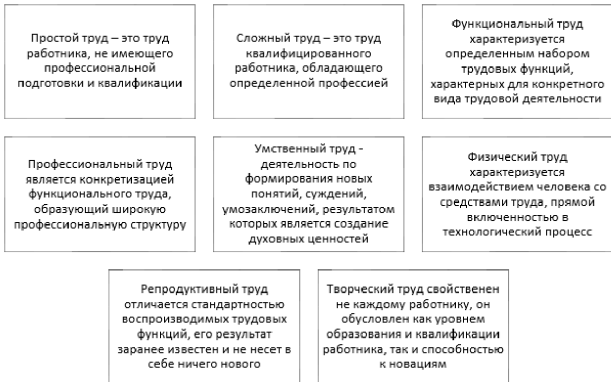
Рисунок 1 – Основные виды труда в зависимости от содержания

Классификация труда в зависимости от содержания представлена на рисунке 1 [2].