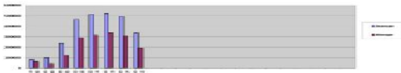
Рисунок-2. Объемы мировой торговли после кризиса 2008 года, млн. долл.

Исходя из представленных данных видно, что число предприятий в 2013 году увеличилось по сравнению с прошлыми годами, а к 2015 году заметно сократилось, что можно объяснить введением санкций и кризис Еврозоны в 2012–2013 годах. Также, сказывается и кризис 2008 года, после которого экономика стран стала развиваться значительно медленнее, отражаясь на объемах мировой торговли (рисунок-2).